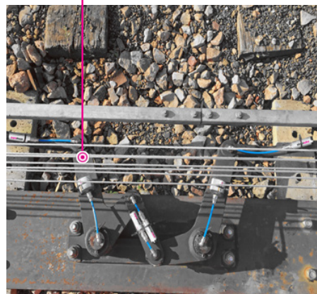
Zwei simalube 30ml und vier simalube 15 ml schmierern kontinuierlich den Komparator einer Signalanlage.