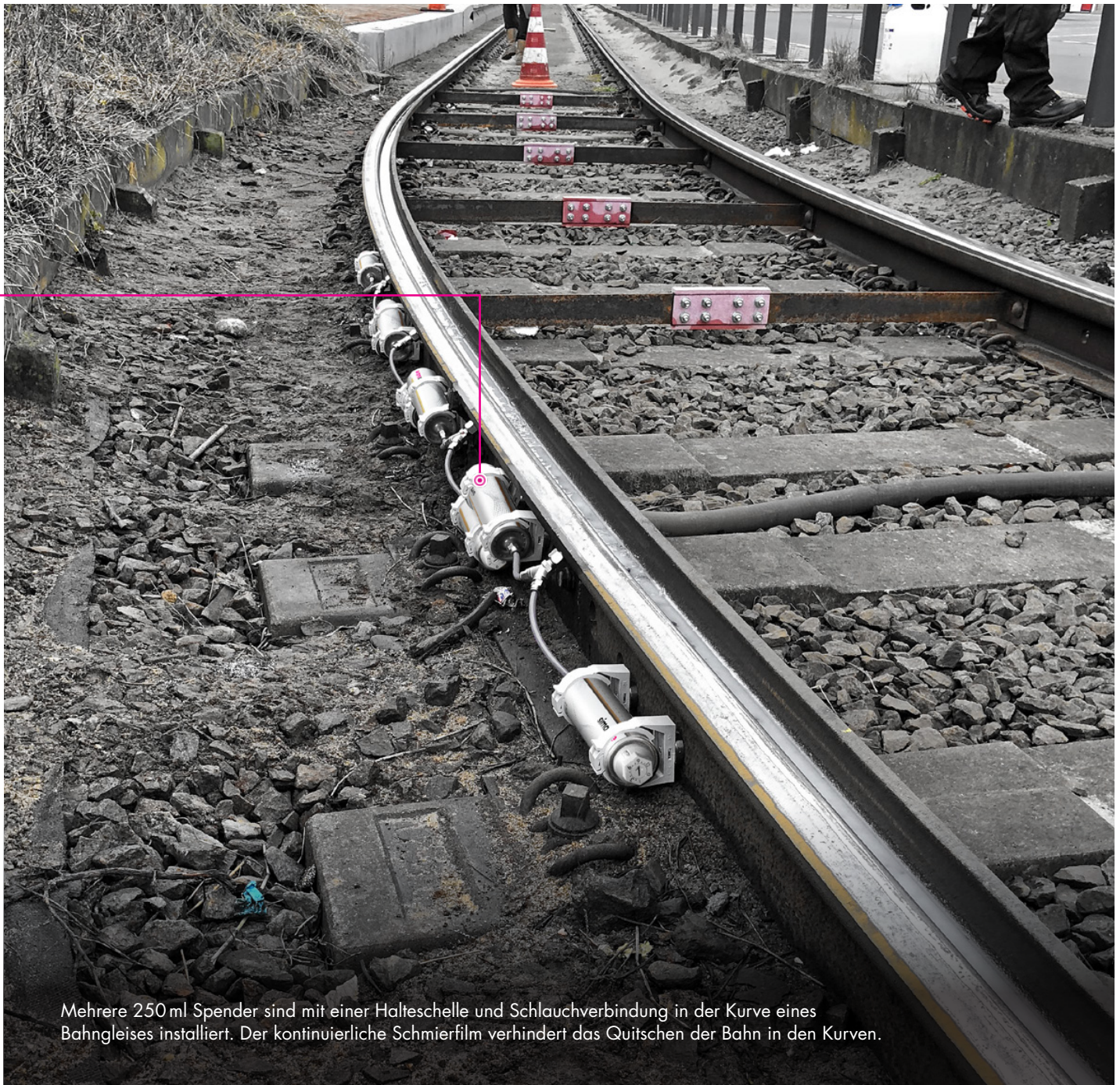
Mehrere 250 ml Spender sind mit einer Halteschelle und Schlauchverbindung in der Kurve eines Bahngleises installiert. Der kontinuierliche Schmierfilm verhindert das Quitschen der Bahn in den Kurven.