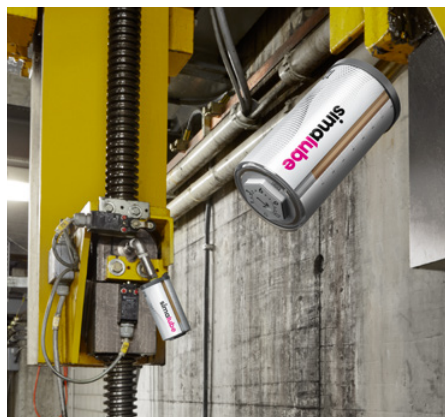
Spindeln einer Hubanlage für Eisenbahnwaggons und Lokomotiven werden mit einem simalube 125 ml über 12 Monate geschmiert.