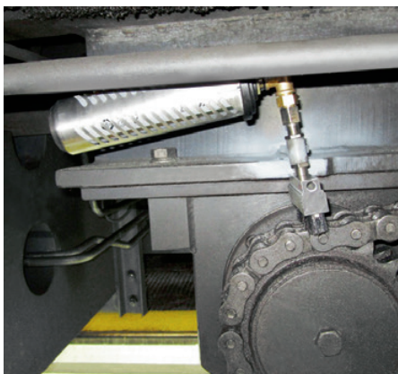
Der simalube 250ml Schmierstoffspender schmiert die Antriebskette eines Schienenbaukrans. Eine Schutzhaube schützt den Spender dabei.