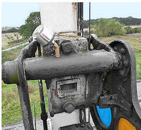
Das Gleitlager eines Eisenbahnsignals wird von einem 30 ml simalube Schmierstoffspender automatisch und kontinuierlich geschmiert.