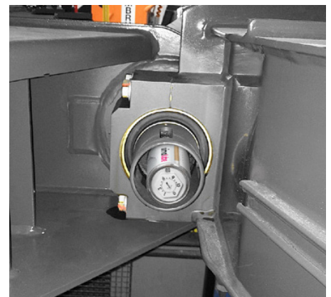
Die Kupplung zweier Eisenbahnwagen ist mit einem simalube 125 ml geschmiert.