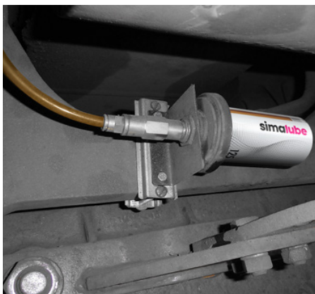
Der 125 ml Spender ist am Chassis einer Niederflurtram installiert. Der Schmierstoff wird über einen Schlauch zum Schmierungspunkt geführt.